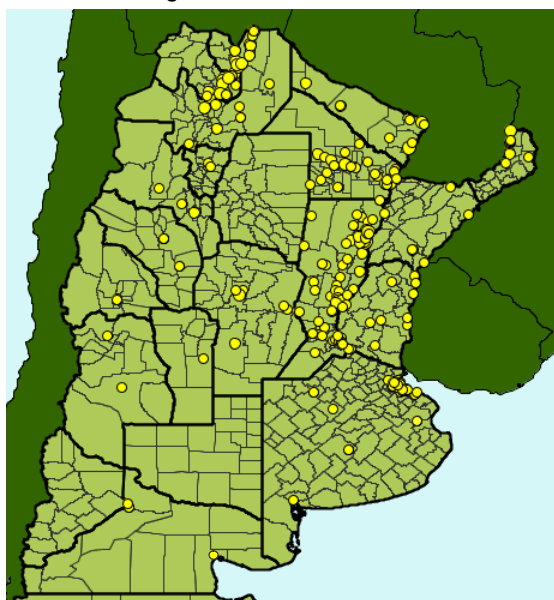
Mapa: Total de pacientes estudiados para dengue por lugar de residencia. Argentina. 01/01/2011 al 27/04/2011. n = 2307

El Ministerio de Salud de la Nación solicita a las provincias fortalecer la vigilancia epidemiológica de dengue a través de la capacitación y sensibilización de los niveles locales para la detección oportuna, estudio y notificación de casos sospechosos.